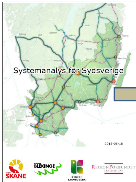
Systemanalys 2015 - kompletterad 2016